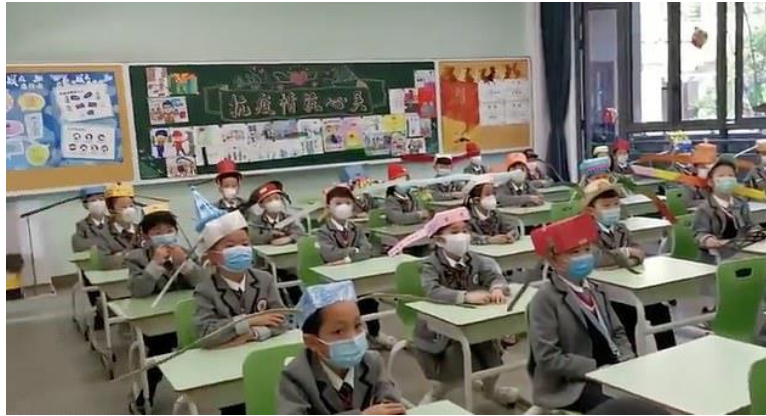
Niños en China usando gorros estilo “dinastía Song” para mantener distancia social.

Mucho se ha dicho y se seguirá diciendo de China, y en general de Asia. Por ejemplo, bajo su última proyección post-COVID-19, el FMI estima que Asia del Este será la única región del mundo que aun crecerá en el presente año, y aun la de mayor crecimiento en los años venideros. Un modelo perfecto de desarrollo no existe, y el modelo chino no es para nada algo cercano a esta utópica perfección. Existen aún algunos aspectos políticos y sociales controversiales, que sin dudas el país hará frente eventualmente. Si embargo, es también cierto que en Occidente usualmente ha faltado cierto ánimo de humildad académica y social para evaluar y analizar varios aspectos interesantes y positivos que puedes rescatarse del modelo chino, entre ellos, los mecanismos y metas claras y concretas que el país asiático se trazó a lo largo de los últimos años.