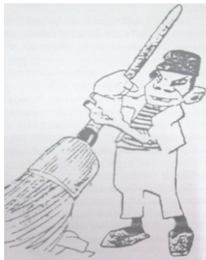
Ilustración 2.- “Los barrenderos chinos”.