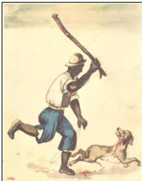
Ilustración 5: Aguador mataperro (1850) - literalmente.