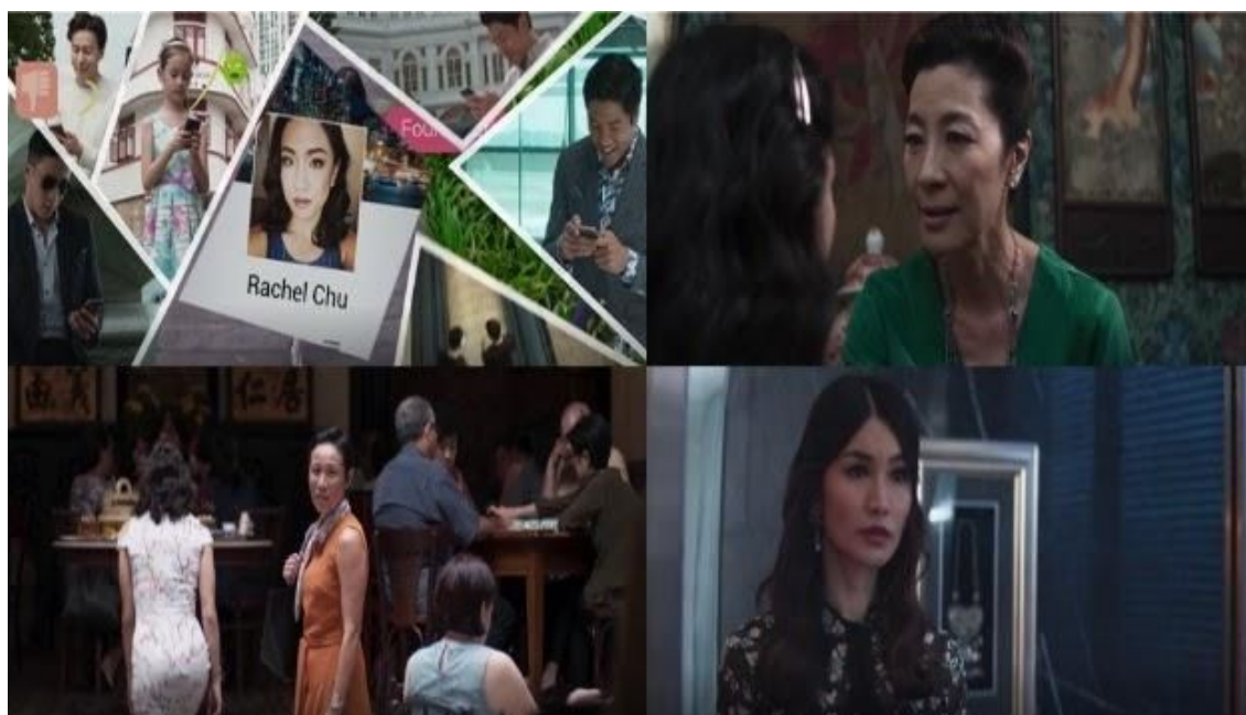
Crazy Rich Asians (2018)

Poniendo de lado los detalles técnicos, lo cierto es que la cinta explora algunos temas que quizá para el público occidental pasan desapercibidos: la ansiedad de los chinos overseas ante el primer encuentro con sus raíces asiáticas; el debate sobre la vigencia de la piedad filial en esta nueva era de reconfiguración entre la relación paternofilial; el empoderamiento de las mujeres; y la importancia del diálogo para abrir puentes de comunicación multicultural.