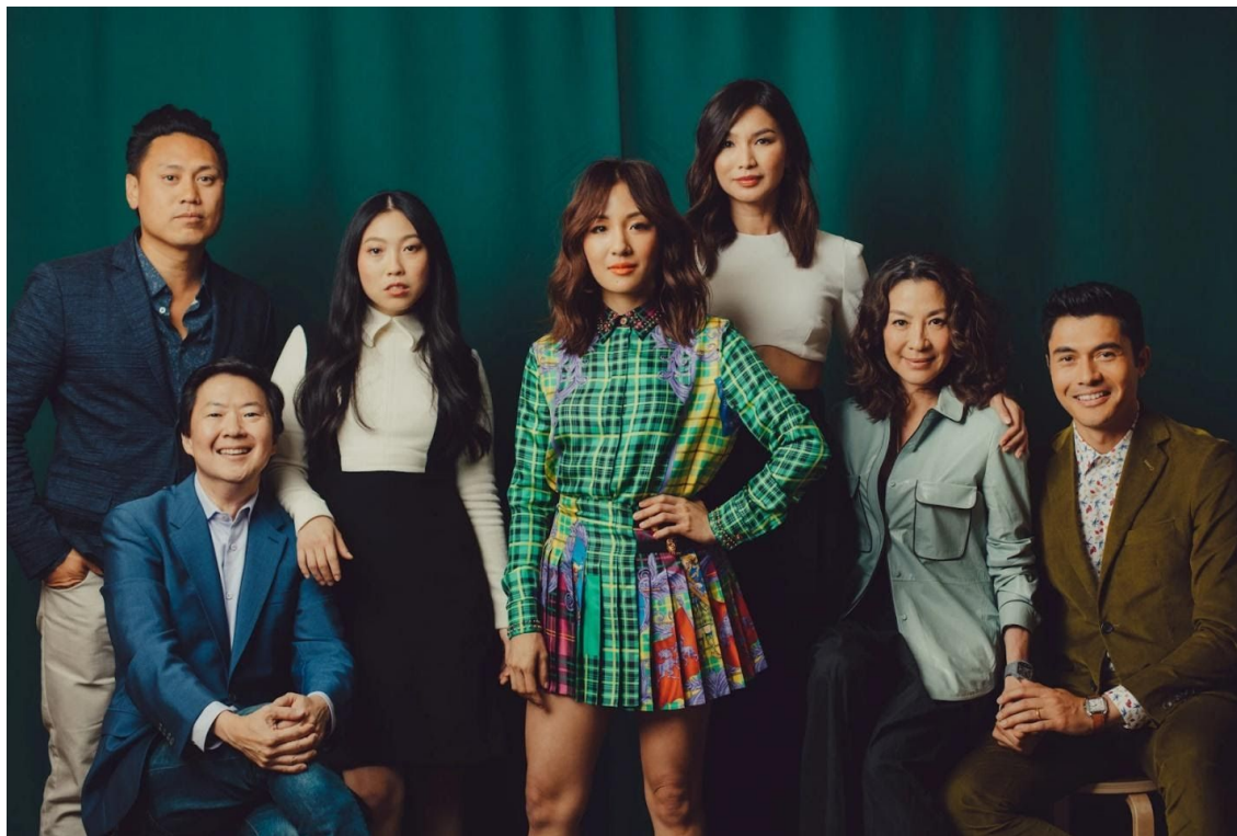
. Miembros del reparto de Crazy Rich Asians (2018) junto al director Jon M. Chu